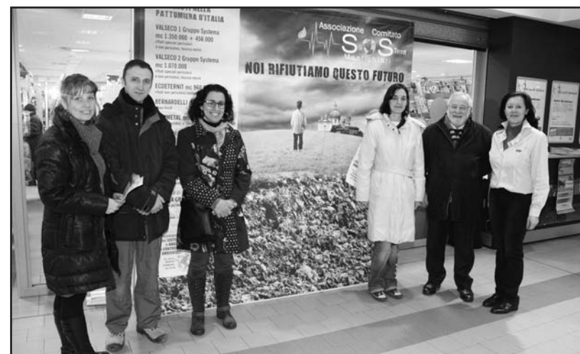
Responsabile di S.O.S. Terra con i rappresentanti del Distretto Coop.

quantità di inquinanti pesanti". Il Distretto Coop consumatori invita quindi i soci a contribuire con i loro punti spesa a sostenere il progetto che porterà VANTAGGI PER LA COMUNITA'. Per la sua realizzazione la cooperativa destinerà 13 euro ogni 500 punti donati. Per informazioni telefona al n° verde 800849085 o visita il sito www.coop.it