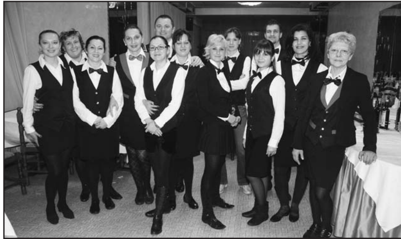
Numerose le cameriere del Green Park Boschetti al servizio della festa.

La lotteria di quest'anno è stata sicuramente la più ricca in assoluto: come sempre cesti pieni di sorprese a cura di CIPRIA e CANDOR (un ringraziamento particolare a Edy per le confezioni), al favoloso cesto floreale del GARDEN SHOP PASINI , dal TRONY a OLTRE LE SCARPE . Proseguendo con i regali ricordiamo la TABACCHERIA RUGGERI , i quadri messi a disposizione da un'amica delle orfanelle, la trombe per auto da ESOTERIC CAR SISTEM , il bracciale di MAURI GIOIELLERIA , per terminare con il tappeto di SHAI TAPPETI . Un elen-