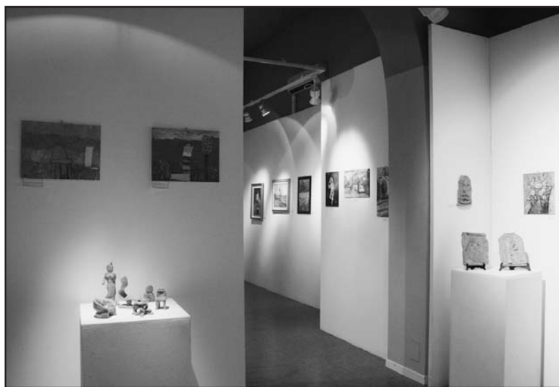
Uno scorcio della mostra presso la Galleria della Proloco.